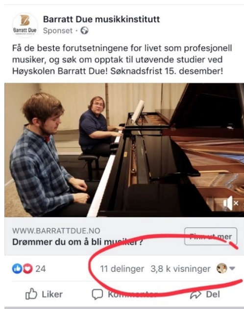
Bilde 1. Promofil BDM-Facebook

Desidert flest mobilenheter og Instagram for denne målgruppen – færre på datamaskin og på Facebook.